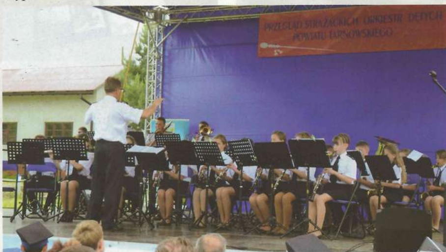
Rzepiennicka orkiestra na przeglądzie

Podczas parady szczególną uwagę widzów przykuły mażoretki z Żurowej, a także debiutujące młodziutkie mażoretki z Rzepiennika Strzyżewskiego.