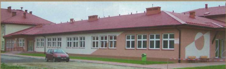
Gimnazjum w Rzepienniku Biskupim

uchwały w sprawie udzielenia lub nieudzielenia absolutorium z tego tytułu,