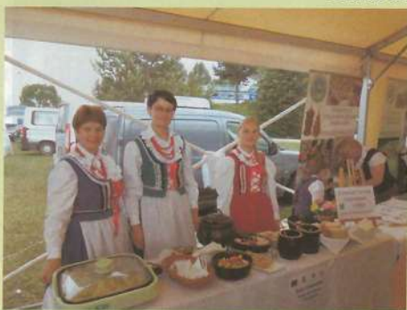
Członkinie Klubu Pań „Domu „Bigosik” z Rzepiennika Suchego wzięły udział w Polsko-Słowackim Festiwalu Smaku