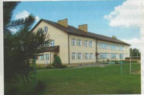
Szkoła z 1966 r.