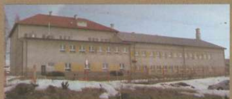
Zespół Szkół w Olszynach