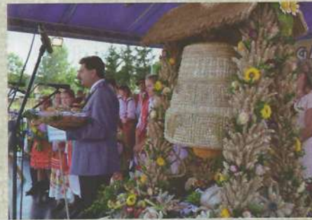
Grupa wieńcowa z Rzepiennika Strzyżewskiego