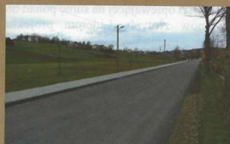
Chodniki w Olszynch