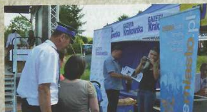
Byliśmy tu razem - Gazeta Krakowska