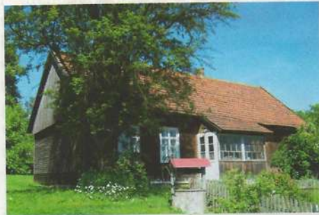
Szkoła ludowa z 1888 r.