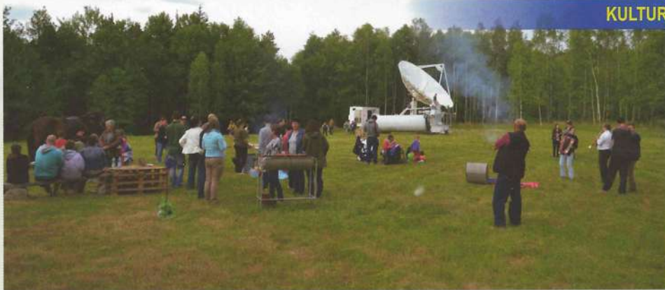
Pod obserwatorium w Rzepienniku Biskupim