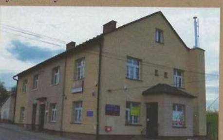
Dom Ludowy w Olszynach