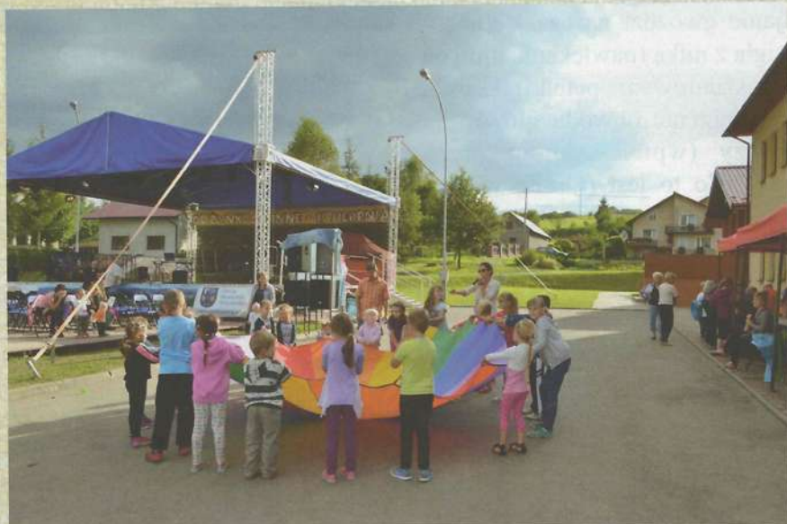
Dzieci podczas zabawy

się z kolorową chustą animacyjną, uczyli nowych piosenek i prostych choreografii tanecznych.