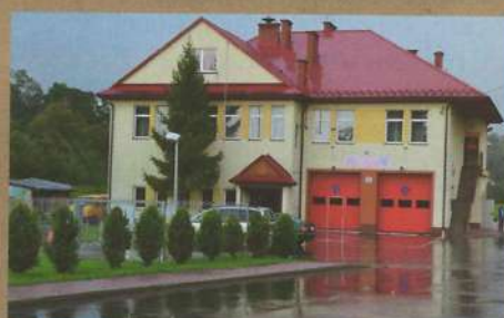
Remiza OSP w Rzepienniku Strzyżewskim