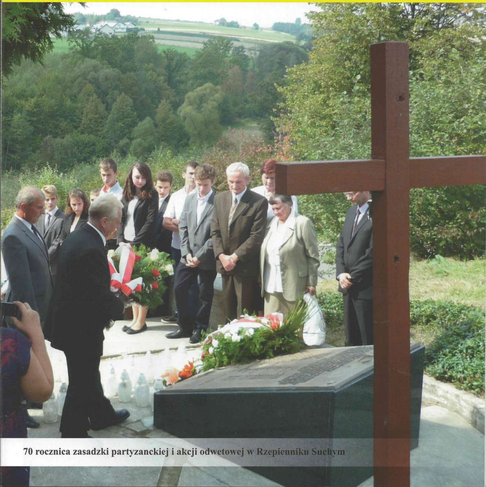
70 rocznica zasadzki partyzanckiej i akcji odwetowej w Rzepienniku Suchym