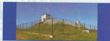
Zbiorniki wodne na Soltysiej Górze

Spółka Komunalna Dorzecze Białej Sp. z o.o w Tuchowie realizuje projekt pn. Uporządkowanie gospodarki wodno-ściekowej zlewni rzeki Biała w ramach programu Czysty Dunajec. ten dotyczy rozbudowy infrastruktury wodno-kanalizacyjnej na terenie 4 gmin – udziałowców spółki: Tuchów, Ciężkowice, Ryglice i Rzepiennik Strzyżewski.