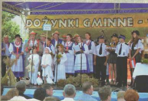
Grupa wieńcowa z Rzepiennika Biskupiego

Zarówno Olszyny jak i Rzepiennik Biskupi wręczyły wieńiec jednostkom Ochotniczych Straży Pożarnych działających w swoich miejscowościach.