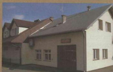
Remiza OSP w Turzy