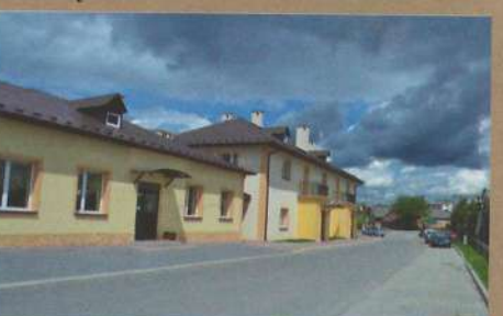
Budynek Gminnego Ośrodka Kultury w Rzepienniku Suchym