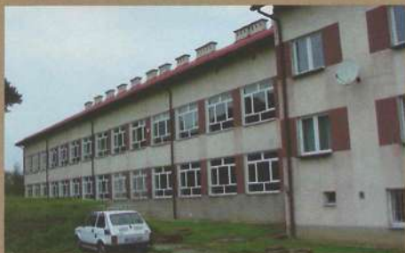
Zespół Szkół w Turzy