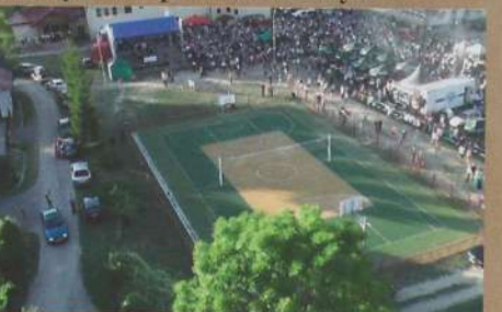
Sala widowiskowa w Rzepienniku Biskupim oraz plac rekreacyjno-sportowy