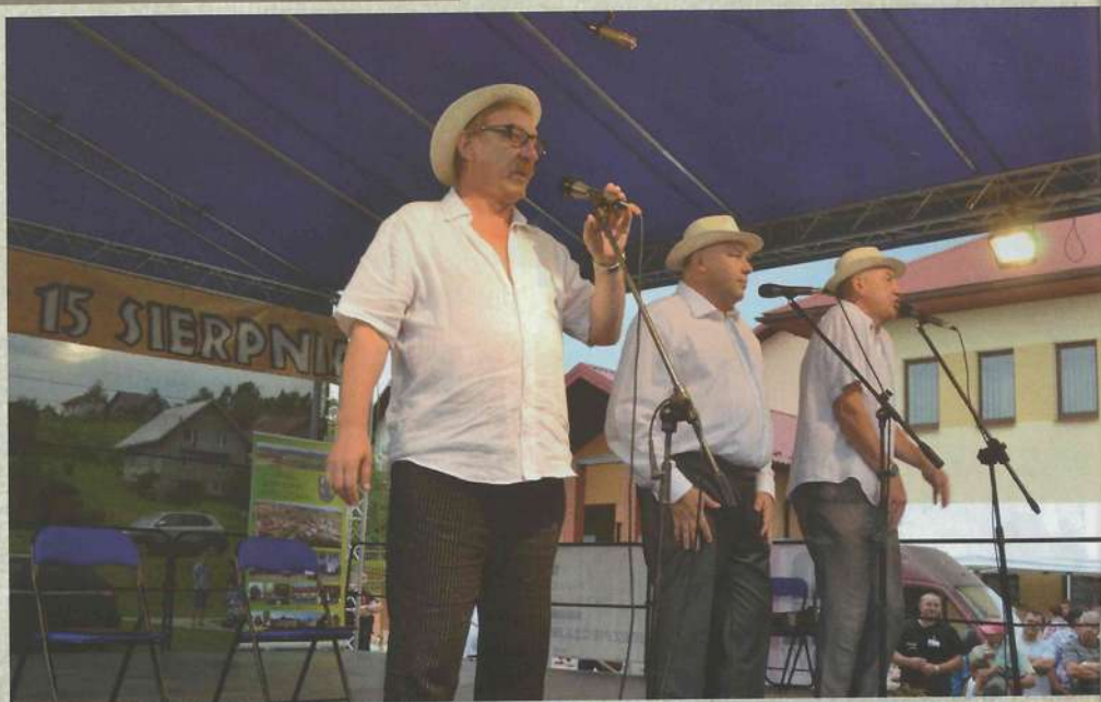
Kabaret KaLaMasz (ławka z serialu Ranczo)