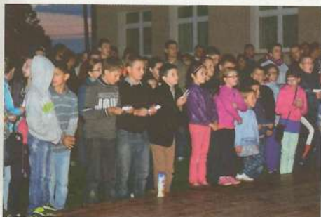
Losowanie nagród głównych

czkami i kupowały losy licząc na wygranie tableta lub chociaż „wielkiej maskotki”. Kiedy tylko pojawiło się słońce – na boisku sportowym odbył się pokaz baniek mydlanych. Tutaj też wystąpił zespół Abba Cover Band grający znane wszystkim przeboje szwedzkiej grupy.