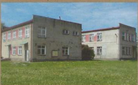
Szkoła Podstawowa w Rzepienniku Strzyżewskim