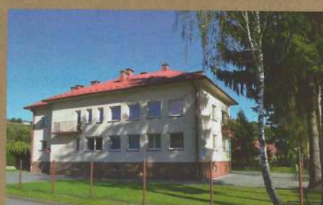
Ośrodek zdrowia w Rzepienniku Strzyżewskim