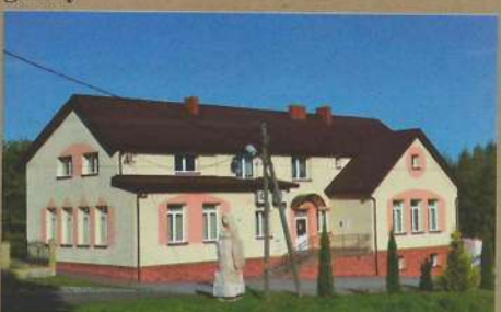
Dom Ludowy w Turzy