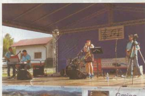
Na scenie prezentuje się zespół Malibo

W niedzielę 27 lipca na plenerowej scenie w Rzepienniku Biskupim odbył się II Przegląd