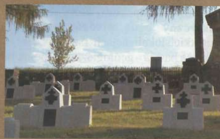
Cmentarz z I wojny światowej w Olszynch