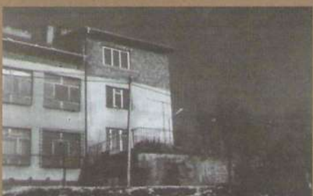
Szkoła w Rzepienniku Biskupim