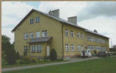
Szkoła Podstawowa w Rzepienniku Suchym