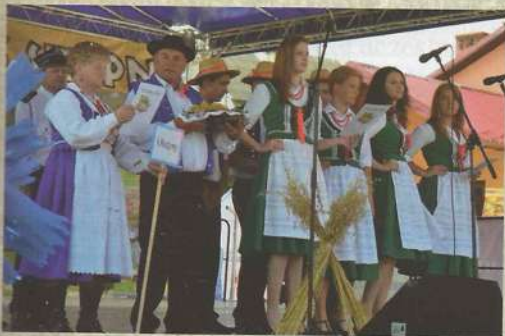
Grupa wieńcowa z Olszyn

Grupa wieńcowa z Turzy, uhonorowała wieńcem aktywnie działające Koło Gospodyń Wiejskich w Turzy.